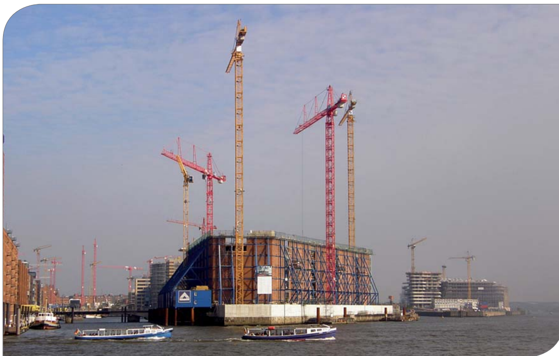
Abb. 1: Die Baustelle der Elbphilharmonie in Hamburg im Oktober 2008. Allein für die Herstellung des verbauten 63.000 m 3 Transportbetons (s. Text) wurden rund 41.000 t Bausand hoher Qualität benötigt.

Der vorliegende Beitrag in der Reihe Commodity TopNews der BGR stellt die aktuelle Versorgungssituation mit Sand in Deutschland dar. Und da nicht Sand, sondern eher Kies und Schotter in Deutschland zukünftig knapp werden könnten, soll zum Schluss dieses Beitrags auch auf diese beiden Massenbaurohstoffe eingegangen werden.