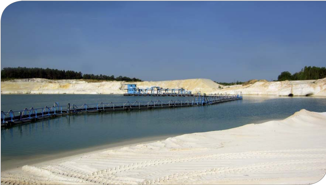
Abb. 2: Gewinnung von hochwertigem Quarzsand durch Saugbaggerschiff im Quarzsandwerk Uhry der Schlingmeier Quarzsand GmbH & Co. KG, Foto: BGR.

Hochwertige Quarzsande finden Verwendung in der: