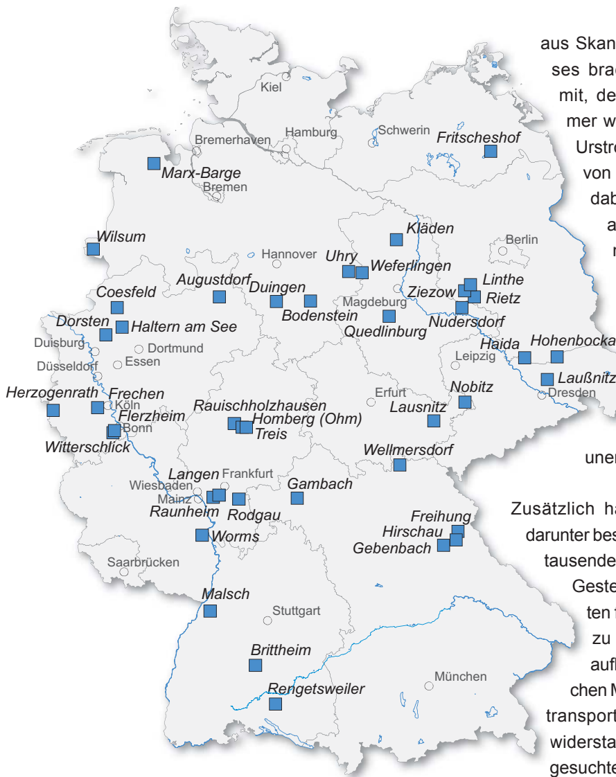
Abb. 3: Gewinnungsstellen von hochwertigem Quarzsand in Deutschland (ELSNER 2016).

hochwertigen Quarzsanden hochreine Quarzsande erzeugt werden.